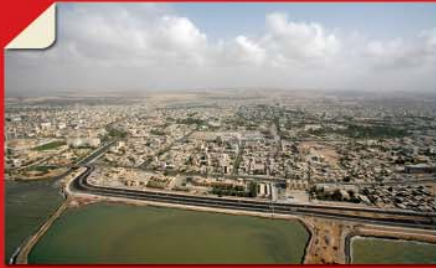
بندرعباس (نمای هوایی) • بهتر ببینیم... صفحه ۲۶۲

فعالیت عمده مردم هرمزگان در زمینه کشاورزی ماهی‌گیری و تجارت است. منطقه میناب و رودان به عنوان قطب‌های کشاورزی استان به شمار می‌آید.