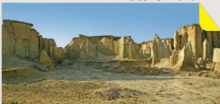
دره ستاره‌ها