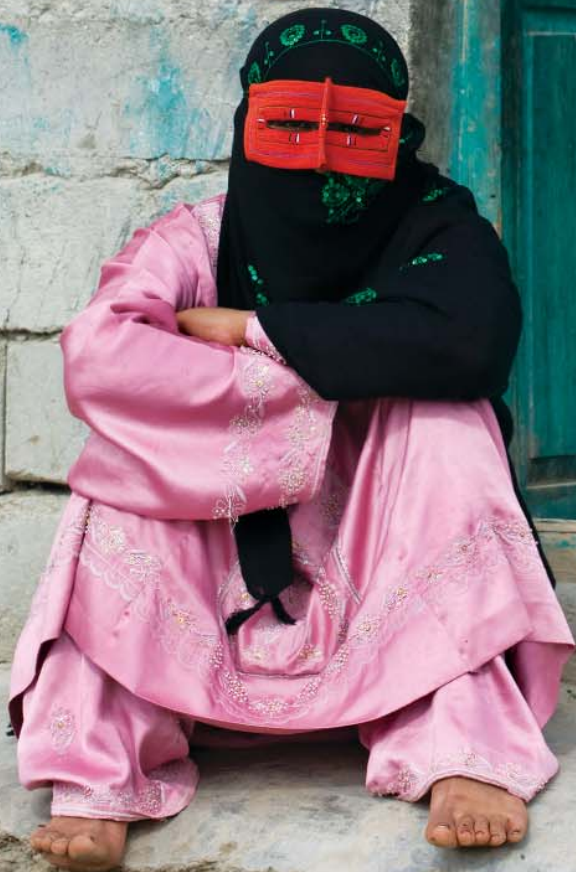
زن جاسکی