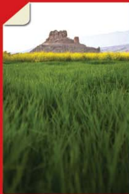
قلعه فین (شهر فین) • بهتر ببینیم... صفحه ۲۸۸