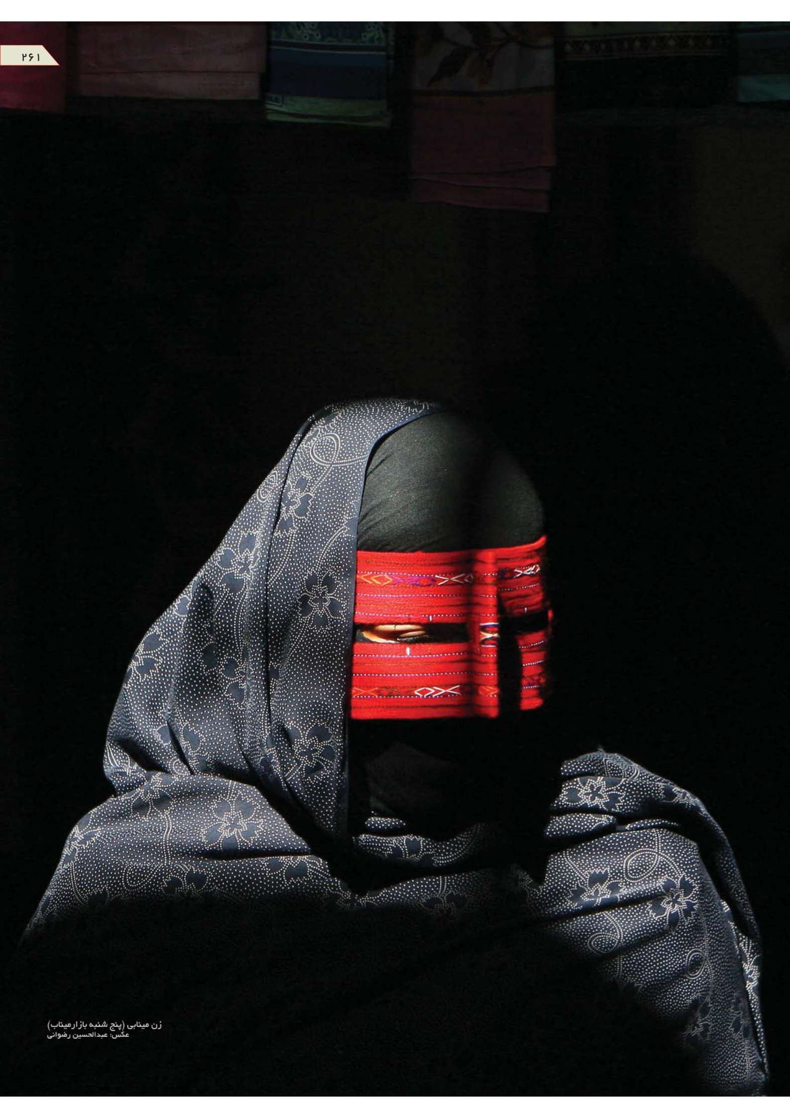
زن مینابی (پنج شنبه بازار میناب)