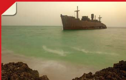
کشتی یونانی (جزیره کیش) • بهتر ببینیم... صفحه ۲۷۸