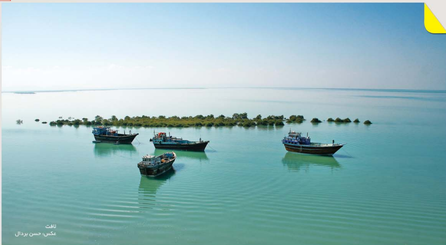
لافت عکس: حسن بردال