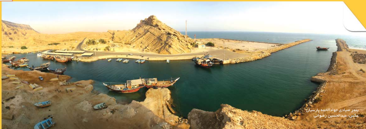
بندر میبادی جوادالمنه پارسیان