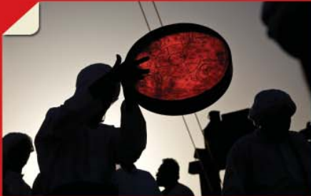
مراسم اضوا (بندرلافت، قشم) • بهتر ببینیم... صفحه ۲۷۴