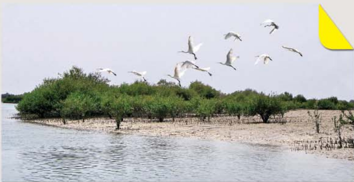
جنگل حرا