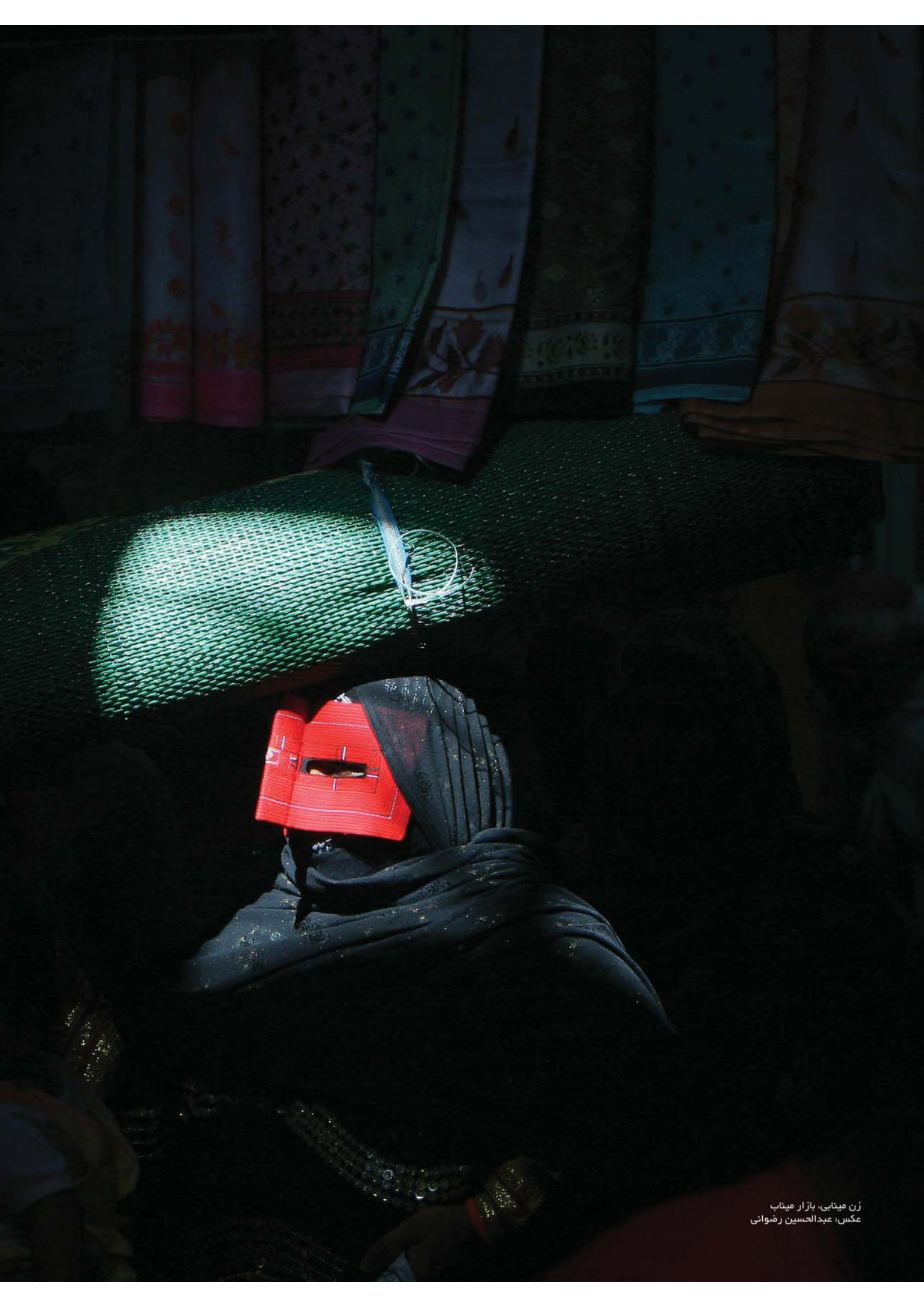
زن مینابی، بازار میناب