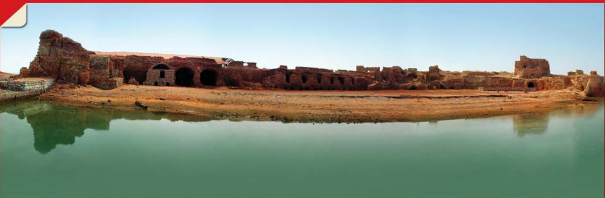
• بهتر ببینیم... صفحه ۲۸۳