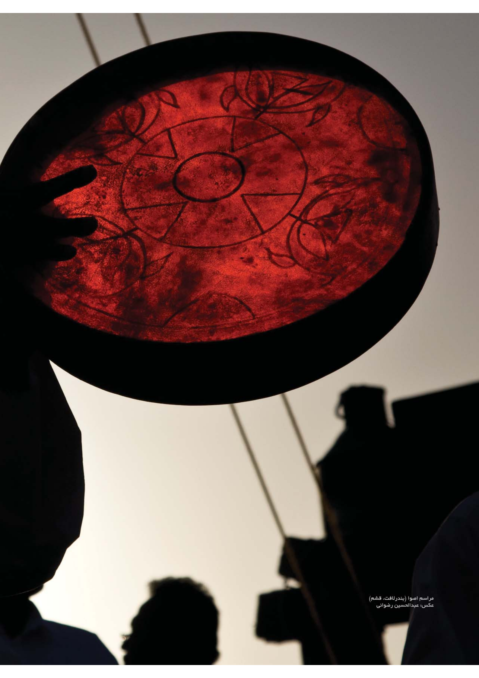
مراسم اموا (بندر لافت، قشم)